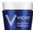
SPA - Intenzivní noční péče (75 ml)

INTENZIVNĚ HYDRATUJE OSVĚŽUJE PLEŤ ROZJASŇUJE VZHLED