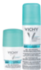
ANTIPERSPIRANT S 48H účinkem, který nezanechává stopy na oblečení Roll-on (50 ml) Sprej (125 ml)