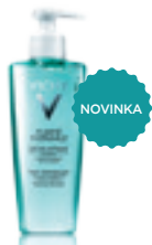
Osvěžující čisticí gel (200 ml)