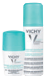
ANTIPERSPIRANT 48H proti nadměrnému pocení Roll-on (50 ml) Sprej (125 ml)